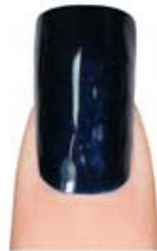
12 - Notturmo