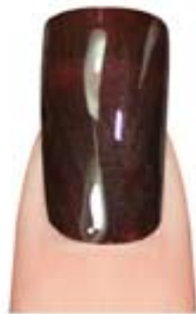
11 - Deep Brown