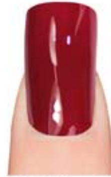
08 - Twisted Red