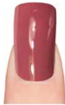
03 - Natural Cover