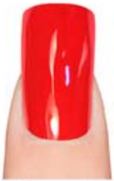
05 - Milano by Night