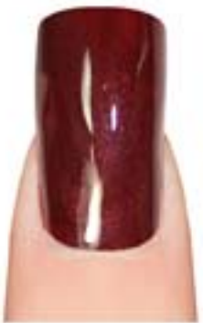
09 - Rouge Fever