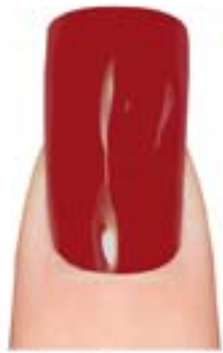
06 - Arabian Night