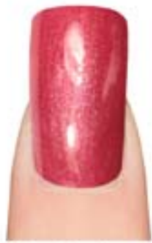
02 - Antique