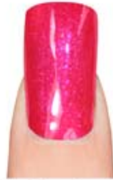
07 - Funky Pink