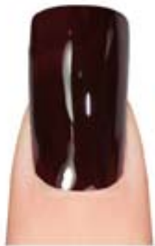
10 - Red Black