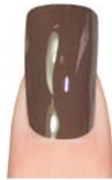
04 - Fashion Mud