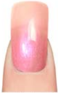
01 - Baby Pink